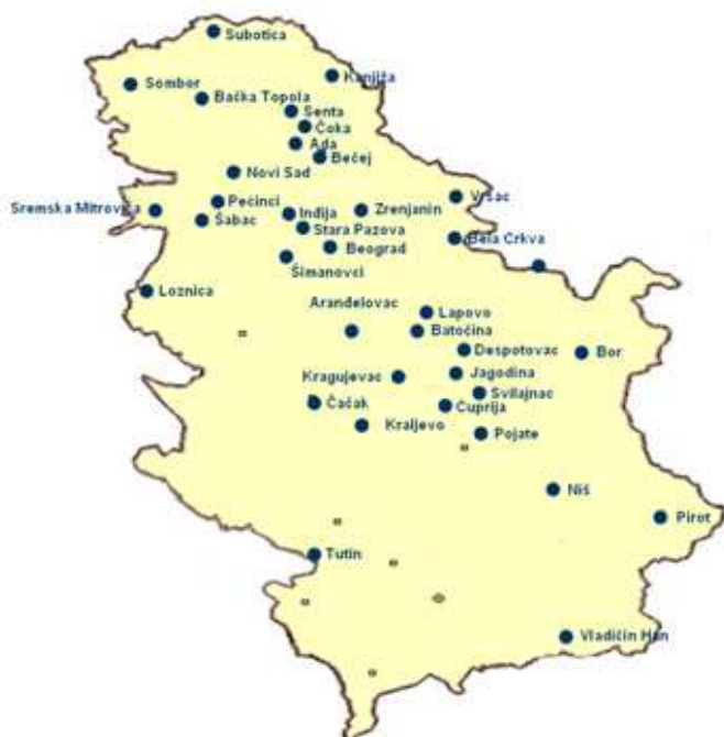
(Lokacije potencijalnih industrijskih parkova u Srbiji)

Kakav model treba primeniti u Srbiji? Iskustva u svetu ne manjkaju. Univerzalni model ne postoji tako da je potrebno primeniti svoj - onaj koji pruža najveću dobrobit. Naslanjajući se na iskustva koja imamo sa slobodnim zonama od sedamdesetih godina prošlog veka i rastućim brojem lokacija koje mogu biti industrijski parkovi najbolji rezultat bi dala simbioza slobodnih zona i industrijskih parkova. U okviru infrastrukturno opremljenog zemljišta sa opštinskim olakšicama za poslovanje ponuditi u jednom delu parka, prostor sa režimom slobodne zone, namenjen proizvodnjama za inostranstvo. To će dati dodatnu atraktivnost prostoru, dok će ostali deo industrijskog parka biti namenjen poslovanju i proizvodnjama za domaće tržište.